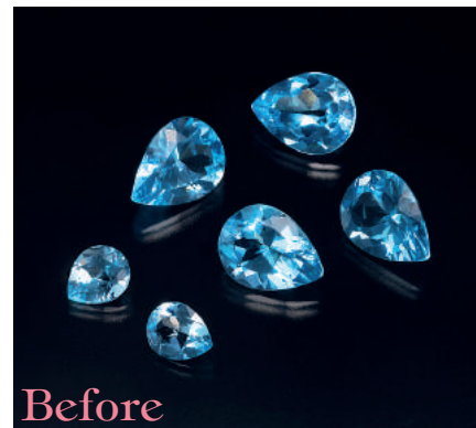
●ブルートパース ルース(裸石)