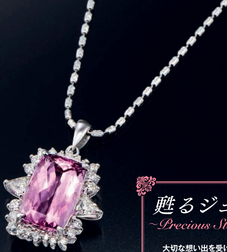
●Ptインベリアルトパースリング