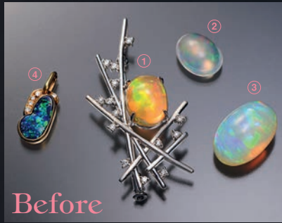
Before ①Pt900ファイアーオパールブローチ兼ペンダント ②ウォーターオパール ③エチオピアオパール ④K18ボルダーオパールペンダント