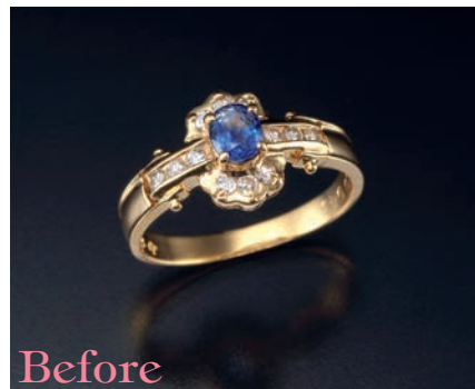
●K18サファイアリング