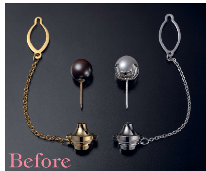
●真珠・黒真珠対タイタックピン